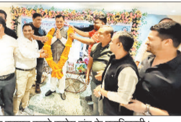
मुख्य अतिथि का स्वागत करते उद्योग संघ के पदाधिकारी।

अब तक प्रदेश को लगभग 7.83 लाख करोड़ के निवेश प्रस्ताव प्राप्त हो चुके हैं। राज्य के बड़े औद्योगिक जिलों के साथ साथ बस्तर से लेकर सरगुजा तक औद्योगिक विकास तेजी से होने जा रहा है। प्रधानमंत्री नरेंद्र मोदी के विकसित भारत के संकल्प के साथ निवेश को गति देने के युवाओं को रोजगार प्रदान की दिशा में मजबूती से कार्य हो रहे हैं। कोर सेक्टर स्टील, संच, एल्यूमिनियम, बिजली के साथ-साथ टेक्सटाइल, फार्मास्यूटिकल, ए आई डाटा सेंटर, होटल, हॉस्पिटल, टूरिज्म, फूड प्रोसेसिंग सहित अन्य सेक्टर के उद्योगों को भी बढ़ावा देने के उद्देश्य के साथ औद्योगिक विकास नीति बनाई गई है, इसका बेहतर प्रतिपाद भी अब दिखने लगा है।