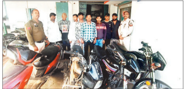
पुलिस गिरफ्त में आरोपी एवं जाप मोटरसाइकिल।