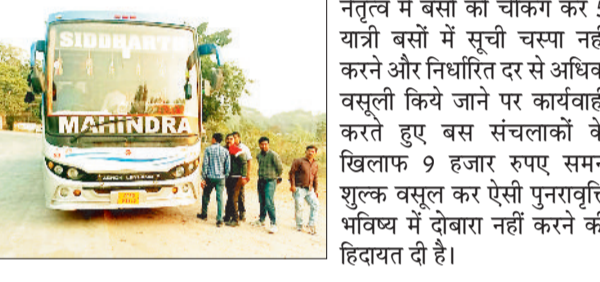
नेतृत्व में बसों की चेकिंग कर 5 यात्री बसों में सूची चस्पा नहीं करने और निर्धारित दर से अधिक वसूली किये जाने पर कार्यवाही करते हुए बस संचालकों के खिलाफ 9 हजार रुपए समन शुल्क वसूल कर ऐसी पुनरावृत्ति भविष्य में दोबारा नहीं करने की हिदायत दी है।