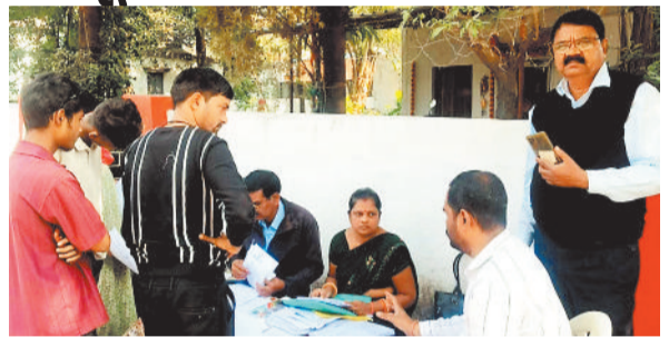
मतदाता सूची में अपने माता पिता का नाम खोजते मतदातागण।